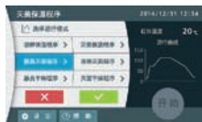
运行模式选择 (器具灭菌程序)