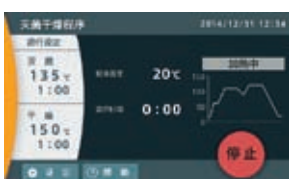
灭菌干燥程序运转