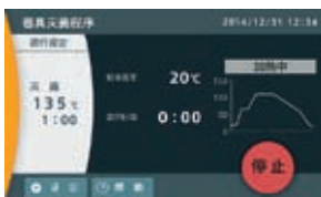
器具灭菌程序运转