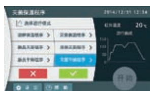
运行模式选择 (灭菌干燥程序)