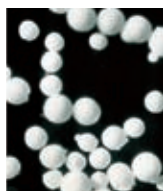
0 50 100um 用DL410生成粉体