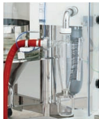
在旋风分离器配置有防止烫伤的安全盖及除静电刷。